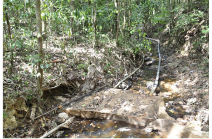
Kiri: Bahaya longsor di Tahura Nipa-Nipa. Kanan: Dam dan pipa-pipa air dibangun tanpa memperhatikan lingkungan.