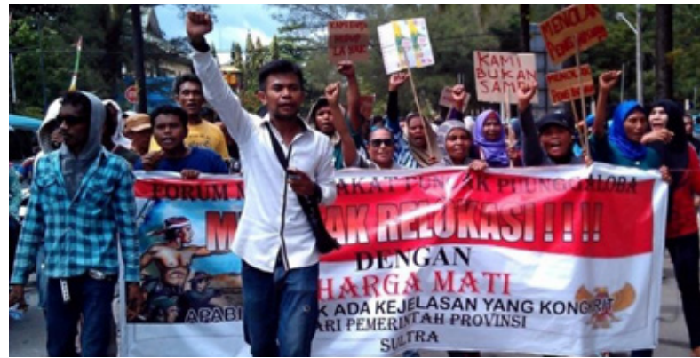
Protes jalanan terhadap pengusuran dari TAHURA.

Pada bulan Desember 2014, Gubernur Sulawesi Selatan menginstruksikan agar 255 keluarga dikeluarkan dari kawasan TAHURA. Instruksi tersebut membuahkan protes dan demonstrasi yang disertai kekerasan. Meskipun ada upaya dari pemerintah untuk menjelaskan Undang-Undang No. 5/1990 tentang konservasi, Undang-Undang No. 41/1999 tentang kehutanan dan Undang-Undang No. 18/2013 tentang perambahan kawasan hutan yang melarang masyarakat untuk hidup di kawasan konservasi dan ancaman akan adanya sanksi berat, masyarakat lokal tetap tidak menerima instruksi tersebut.