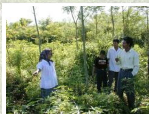
Pemilik lahan (kiri) di Lampung Utara, Indonesia, mengemukakan persepsinya tentang manfaat reforestasi dari alang-alang

Praktik terbaik untuk berbagai jenis mekanisme lokal dan nasional yang dapat digunakan untuk mereduksi emisi karbon melalui deforestasi yang terhindarkan, dengan potensi biaya transaksi yang lebih rendah dari proyek-proyek CDM, sudah mulai bermunculan. Mekanisme berbasis insentif dan keadilan dapat diletakkan dalam posisi yang mampu mengurangi emisi karbon dari deforestasi yang terhindarkan, sekaligus mempertahankan aset dasar, keadilan, dan kemakmuran bagi masyarakat yang bergantung pada sumber daya tersebut. Negara-negara seperti Costa Rica dan Meksiko telah memiliki pengalaman yang substansial dalam mengimplementasikan mekanisme tersebut dalam skala nasional dan sub-nasional. Program-program penghilangan hutan dalam skala besar, seperti yang terjadi di Indonesia, Cina, dan India dapat direvisi dengan menyediakan insentif yang lebih besar untuk menghindari emisi karbon melalui deforestasi yang terhindarkan. Berbagai bukti dari kasus-kasus di Asia dan area tropis lainnya menunjukkan realisme, kebersyaratan, kesukarelaan, dan pemihakan pada kemiskinan adalah kriteria penting untuk mengevaluasi mekanisme berbasis insentif dan keadilan. ( www.worldagroforestrycentre.org/sea/networks/rupes ). http://www.cifor.cgiar.org/carbofor/_ref/home/index.htm ; http://www.worldagroforestry.org/es/default.asp http://www.worldagroforestry.org/sea/Networks/RUPES/index.asp ; http://www.asb.cgiar.org/