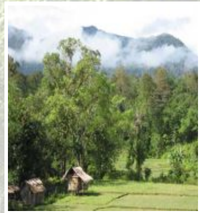
Zona transisi antara pertanian dan hutan alam yang cukup stabil sering terwujudkan melalusebuah zona 'wanatani' yang memberikan peluang untuk 'pengurangan emisi dari deforestasi' (contoh dari Jambi)

Brosur ini menyarikan contoh kasus dari Deforestasi yang Terhindarkan dengan Manfaat yang Berkelanjutan (Avoided Deforestation with Sustainable Benefits - ADSB) sebagai suatu cara sederhana untuk mengurangi emisi karbon.