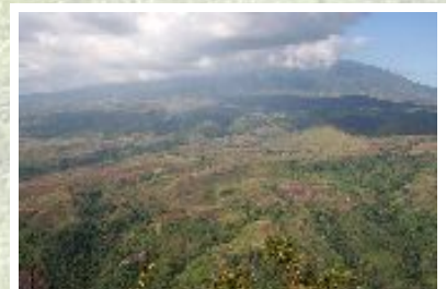
Banyak hutan di daerah tropis yang sudah dialihgunakan dengan keuntungan ekonomi yang rendah, hanya dikarenakan nilai kayunya merupakan daya tarik bagi investor dari luar dan tidak seseorangpun bisa mengontrol secara efektif.