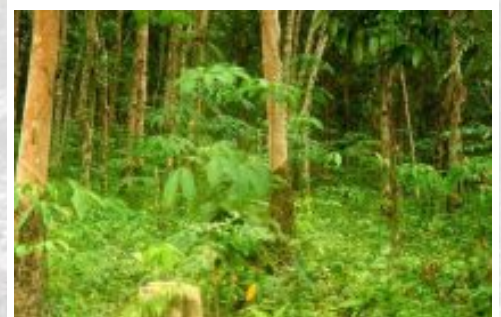
Sebagian besar lanskap yang dikelola dengan pepohonan, seperti wanatani karet di Sumatra Utara, mencampurkan antara hutan dan pertanian, tetapi tidak bisa disebut sebagai hutan dalam definisi hutan yang dipakai pada saat ini.