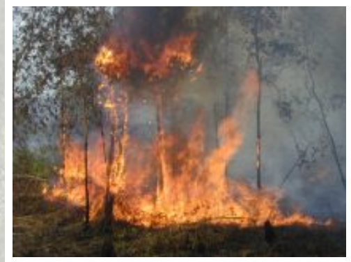
Pembakaran masih merupakan cara termurah untuk membersihkan lanskap yang kaya akan karbon. Nilai ekonomis dari penggunaan lahan selanjutnya bisa lebih rendah daripada biaya konversi lahan dipandang dari sisi global