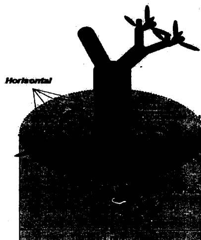
Gambar 2. Skema pengukuran diameter akar utama (proximal root) pada berbagai jenis pohon ( d = diameter akar utama)

Pengukuran distribusi perakaran sifatnya semi destruktif yang diawali dengan penggalian lubang tanah di sekitar pohon, dengan diameter lubang sekitar 1 m (Gambar 2).