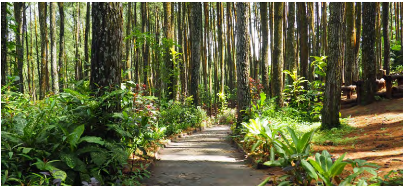
Hutan Pinus Mangunan

Operasionalisasi KPH Yogyakarta didukung secara penuh oleh Gubernur Daerah Istimewa Yogyakarta. Dalam pendanaannya, KPH Yogyakarta beroperasi dari dukungan dana pemerintah. Hasil bisnis dari pengelolaan hutan oleh KPH pada umumnya diatur sendiri oleh KPH dengan tetap berkontribusi ke PAD Daerah. KPH diberi kebebasan untuk menentukan kontribusi bagi hasil yang ideal antara KPH beserta mitra usahanya termasuk dengan masyarakat di daerah.