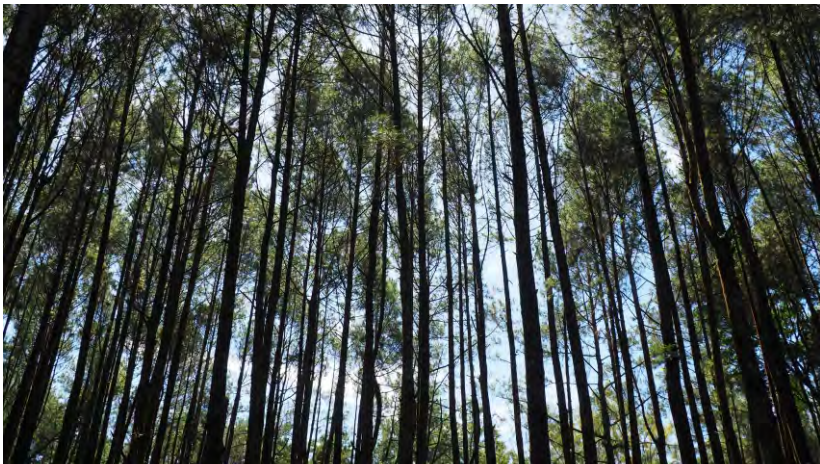
Tegakan Pinus, Hutan Pinus Mangunan

Kehadiran KPH sebagai organisasi baru harus diikuti dengan perubahan peran dan kewenangan dan perubahan kegiatan pengelolaan hutan. Kartodihardjo (2014) menyatakan bahwa keberadaan KPH yang diharapkan beroperasi profesional dan mandiri menjadikan Dinas Lingkungan Hidup dan Kehutanan, unit pelaksana teknis (UPT) Kementerian yang membidangi kehutanan harus melakukan reposisi. Namun operasionalisasi dari konsepsi KPH masih sering menimbulkan pertanyaan, terutama berkaitan dengan bentuk dan hubungan kelembagaan yang ideal. Hal ini sering mengakibatkan tidak berjalannya proses dan aktivitas pengelolaan di hutan secara baik, serta putusanya jalur informasi yang terjadidilapangan dengan keputusan yang diambil di tingkat pemerintah.