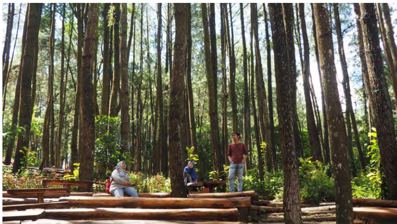
Sekolah Hutan, Hutan Pinus Mangunan