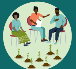
ጥንዶች፣ ቤተሰብ እና ጓደኞች ከተጋቡ ጥንዶች እና ከተመረጡ ቤተሰብ/ጓደኛ ጋር የተደረገ ቃለ ምልልስ

በማህበረሰብ ደረጃ ያሉ የሥርዓተ ጾታ ወገኖች/ልማዶችን መንስህዎች መረዳት አስፈላጊ ነው። እነዚህ መንስህዎች ሴቶች የሁለት መብቶቻቸውን ሙሉ በሙሉ አውቅና እንዲያገኙና እንዲይጠቀሙባቸው የሚያደርጉ ወይም የሚያሰገድዱ ናቸው።