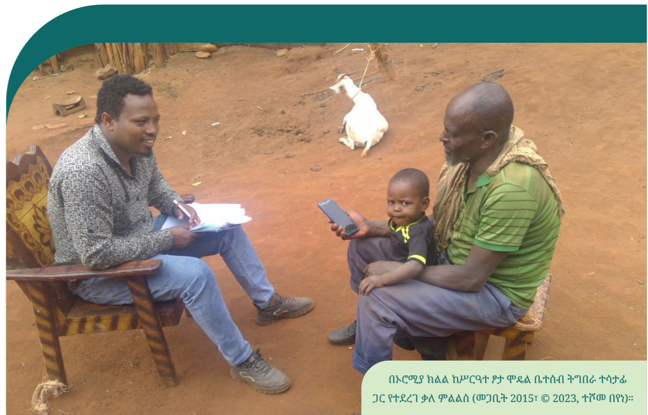
በኦሮሚያ ክልል ከሥርዓተ ጾታ ሞዴል ቤተሰብ ትግበራ ተሳታፊ ጋር የተደረገ ቃለ ምልልስ (መጋቢት 2015)።

የሥርዓተ ጾታ ሞዴል ቤተሰብ (GME) በተሳተፈው አነስተኛ መሰኛ ልማት ፕሮግራም II በ2011 ዓ.ም. በሶስት አነስተኛ መሰኛ ፕሮጀክቶች ውስጥ በሶስት መንደሮች 44 አርእያ ቤተሰቦችን በማካተት በሙከራ ደረጃ ተጀምሮ ነበር። ስለሆነም የተገኙት ውጤቶች በጣም አበረታች ነበሩ። ፕሮጀክቱ ተሞክሮውን በተጨማሪ ወደ ሌሎች አካባቢዎች ለማስፋት በመወሰን አሁን በ56 የአነስተኛ መሰኛ ፕሮጀክቶች ውስጥ 744 አርእያ እና 3,157 ተከታይ ቤተሰቦችን፣ ጠቅላላ 3901 ቤተሰቦችን በማካተት እየተተገበረ ይገኛል።