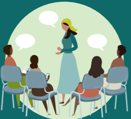
የአትኩሮት ቡድን ውይይቶች (FGD) ከሥርዓተ ጾታ ሞዴል ቤተሰብ ተሳታፊዎች እና ተሳታፊ ካልሆኑት ጋር

ነገር እና ሊተገበሩ የሚችሉ ተግባራትን፣ መልካም ተሞክሮዎችን፣ እደጋዎችን እና ውድቀቶችን መመርመር።