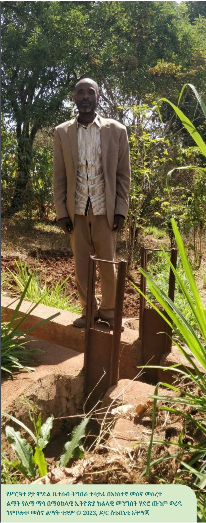
የሥርዓተ ስነ ስርዓት ልማዳዊ ቤተሰብ ትግበራ ተሳታፊ በአነስተኛ መሰኛ መሰረተ ልማት የለማ ማሳ በማዕከላዊ ኢትዮጵያ ክልላዊ መንግሥት ሃይሮ ጡንጦ ወረዳ ጎምቦሎዞ መሰኛ ልማት ተቋም