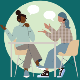
ቁልፍ መረጃ ሰጪ ግለሰቦች ጋር ቃለ-መጠይቆች (KII): ከፕሮጀክቱ ሠራተኞች ጋር

ይህ የሥርዓተ-ጾታ ትንተና ዘዴ ዓይነታዊና የአንድ ጉዳይ ጥናቶችን ከGENNOVATE እና Pro-WEAI የተወሰዱ ፕሮቶኮሎችን ተጠቅሟል። በኢትዮጵያ የሚከተሉት የተለያዩ የመረጃ አሰባሰብ ዘዴዎች ጥቅም ላይ ውለዋል፡