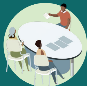
ENTREVISTAS CON INFORMANTES CLAVE PARA ELABORAR PERFILES COMUNITARIOS MEDIANTE ENTREVISTAS GRUPALES E INDIVIDUALES.

Comprensión de los factores comunitarios que generan o refuerzan las normas de género que impiden el pleno reconocimiento y disfrute de los derechos sobre los recursos.