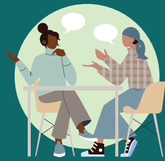
ENTREVISTAS DE INFORMANTES CLAVE CON EL PERSONAL DEL PROYECTO

La metodología de análisis de género utilizó estudios de casos cualitativos y protocolos adaptados de GENNOVATE y Pro-WEAI para recopilar datos. Se emplearon varios métodos de recopilación de datos: