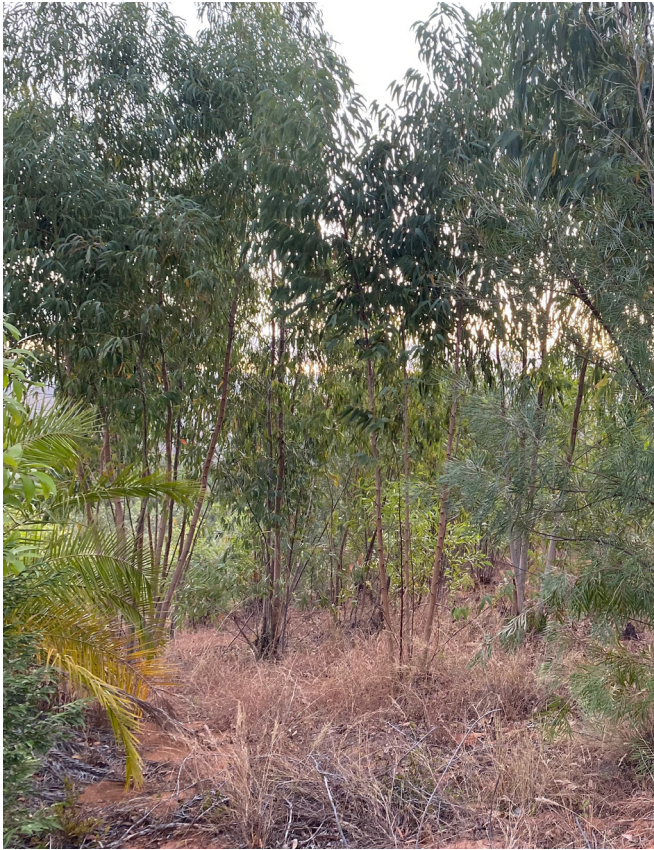
Figure 2. Plantation d'eucalyptus à Sadjoavato